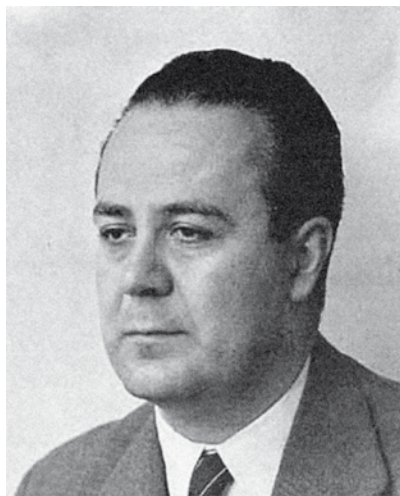
Fig. 2. Francisco Prieto-Moreno Pardo (Granada, 1907-Madrid, 1985)

Pero, sin duda alguna, la figura que más le influencia es Francisco Prieto-Moreno 30 [Fig. 2], quien fuera profesor suyo en la asignatura “ Jardinería y Paisaje ” (5º curso), materia que se impartía de forma novedosa en nuestro país desde 1957 (como resultado del interés que le presta Prieto-Moreno a este tema, como lo demuestran algunas de sus publicaciones 31 ), y en el